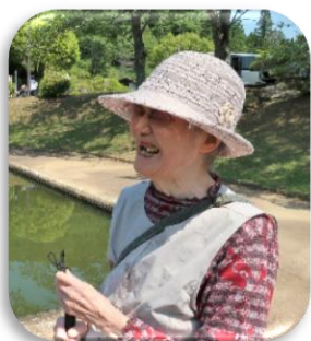
手をたたくと鯉が寄ってきます