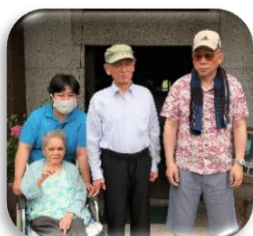
うな重旨かったよー