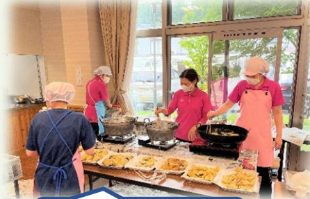
どれも揚げたてです