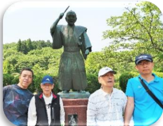
吉四六像の前でハイチーズ